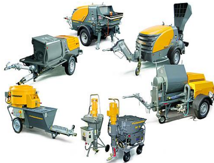
Anbauteile und Vormontagegruppen (auch Komplettgeräte)